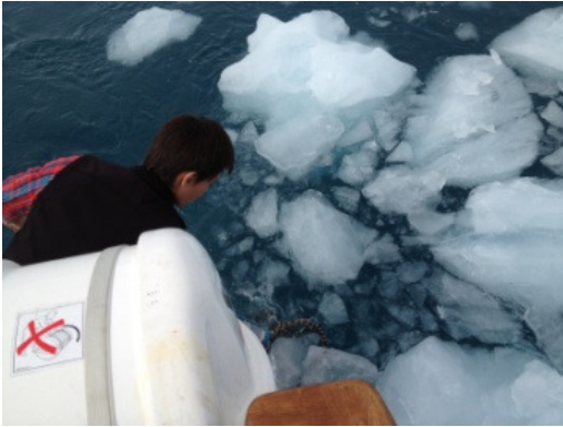
Skippers medhjælper fisker indlandsis op til gæsterne.