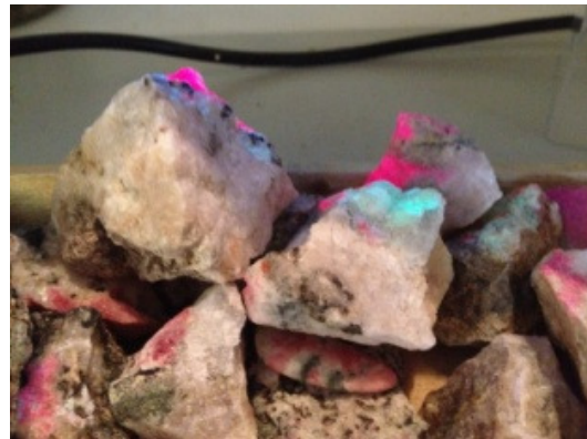
Den lyserøde sten Tugtupit findes kun i tæt på uran, og det er der i Kvanefjeld ved Narsaq. Hvordan og hvorvidt der skal udvindes uran diskuteres meget i Grønland og internationalt. Her er tugtupitten UV-belyst og de områder, der lyser grønt, er mildt radioaktive.