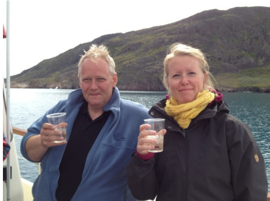
Isen blev til knitrende isterninger i en drink. I det hele taget knitrede fjorden af luftbobler der forlod de smeltende isbjerge. Det er en dejlig lyd Hjemme igen får vi hvalbiksemad.